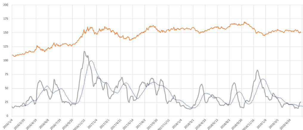
文华商品指数走势与波动率对比